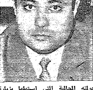
جولته الحالية التي استهلها بزيارة عمان وسيفار الكويت صباح أمس في المرحلة الأخيرة من هذه الجولة في باريس .

وقال السيد اليكوس صباح أمس في الكويت التي تقبلها ليبيا في زيارة الشيخ صباح الصباح أمير الكويت في قصر السيف ثم زار الشيخ جابر الصباح رئيس الوزراء وولي العهد في مكتبه . وتوجه بعد ذلك الى محافظة الأحمدية حيث تفقد الممتلكات الصناعية والنقلية وكان السيد اليكوس قد وصل أمس الاول الى الكويت من الرياض ضمن